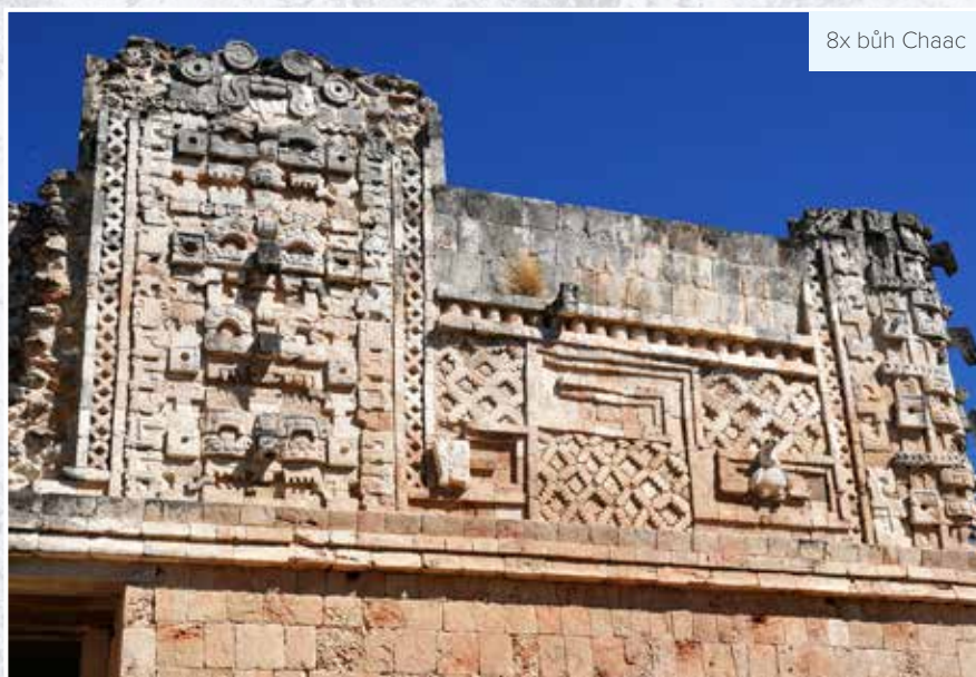
8x bůh Chaac

Na druhém výletě jsme jeli několik kilometrů hustou džunglí až na osamělé místo, kde měl své hospodářství šaman Fredy. Bydlel