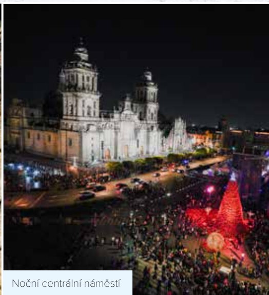
Noční centrální náměstí

byly vhazovány lidské oběti. S těmi lidskými oběťmi to prý ale bylo trochu jinak, než si představujeme. Mayoové po celou svou dlouhou historii obětovali hlavně zemědělské plodiny a vážili si života. Teprve v poklasickém období, kdy je začala ovlivňovat kultura Aztéků a Toltéků, se staly jejich obřady krvavějšími.