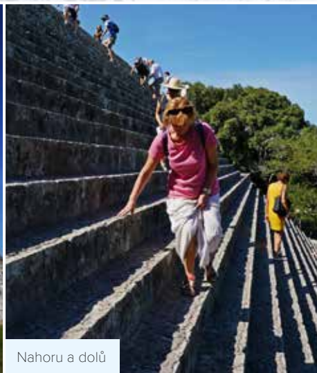
Nahoru a dolů

zilice Panny Marie Guadalupské, u jejího „zázračného“ obrazu, snad nejvýznamnějšího poutního místa křesťanů v celé Americe. Dodnes není uspokojivě vysvětlen svěží vzhled a zchovalost tohoto obrazu, i když pochází z roku 1531.