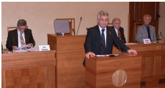
U řečnického pultu Milan Štěch

Na závěr semináře účastníci přijali Memorandum, které bylo prezentováno vedení Senátu a také novinářům na následné tiskové konferenci. „ Rada seniorů ČR a účastníci semináře vyzývají obě komory Parlamentu, aby, s ohledem na vážnost situace a na odpovědnost zákonodárců, zřídily svoje odborné struktury (výbory, podvýbory, komise) pro problematiku seniorů a stárnutí populace. Současně je požadováno důstojné zastoupení RS ČR v těchto orgánech “.