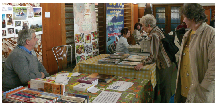
Stánek s naším měsíčníkem lidé nemohli přehlédnout a také ani nepřehlíželi...