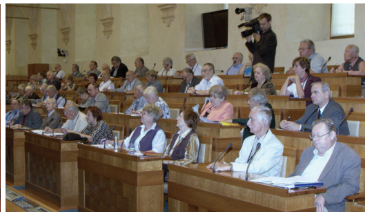
Účastníci semináře v Senátu PČR