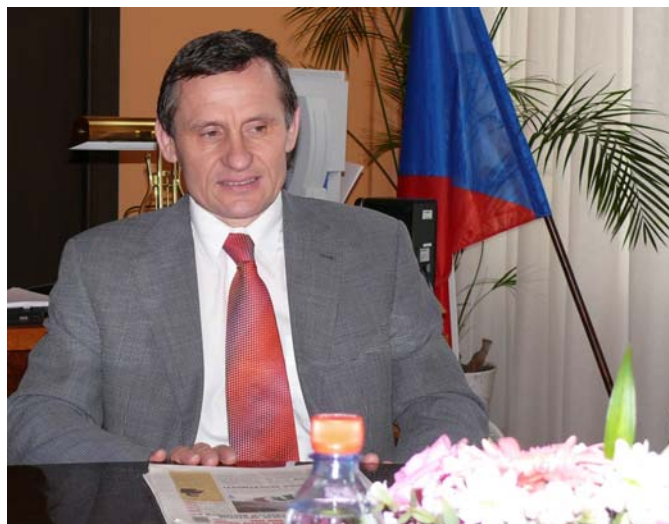
Snímek z jednání na MMR s Jiřím Čunkem