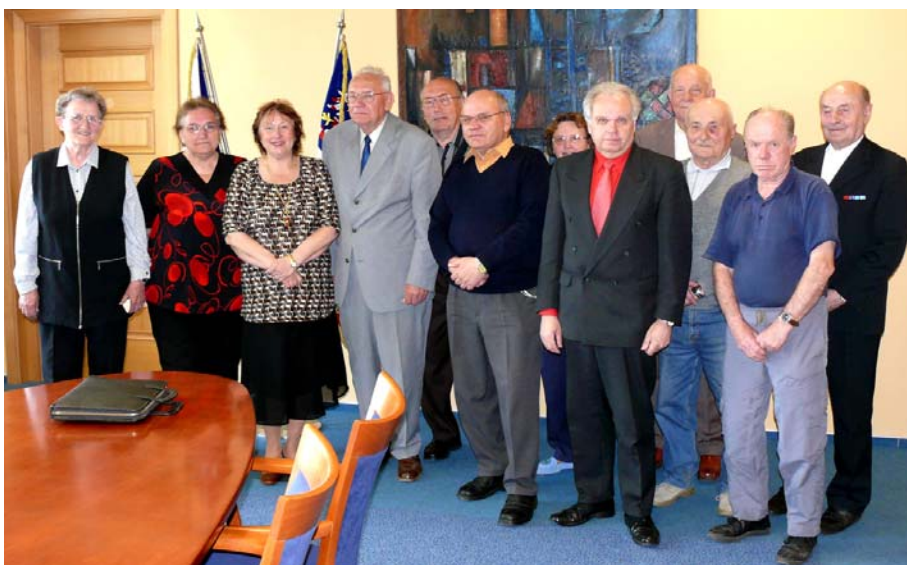
Ustavení Krajské Rady seniorů kraje Vysočina

Za dostupnost a kvalitu zdravotní péče, za dostupnost sociálních služeb, a to nejen rezidenčních ale také ambulantních a terénních, za dopravní obslužnost území, za komoditní plány a to včetně financování volnočasových aktivit a bezplatného poradenství pro seniory odpovídají krajské samosprávy a krajské úřady. Obdobně též samosprávy statutárních měst, které navíc odpovídají za dostupnost bydlení seniorů, za nabídku a podmínky jejich kulturního a společenského vyžití, za rozvoj klubové činnosti, atd. Spoluúčast na přípravě, rozhodování a v neposlední řadě také na kontrole výkonu těchto činností je tedy významným posláním Rady seniorů, které je realizováno prostřednictvím krajských a městských složek její vnitřní organizační výstavby. Rok 2008 byl rokem dalšího rozšiřování krajských a komunálních funkcí Rady seniorů ČR. A to o jeden kraj a o jedno město.