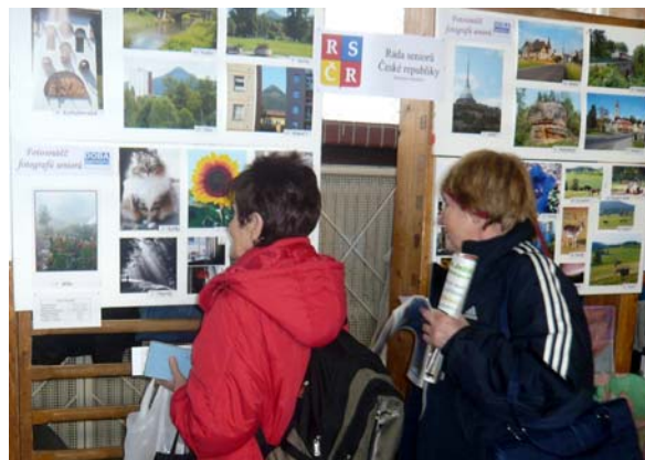
Návštěvníci hodnotili vystavené fotografie