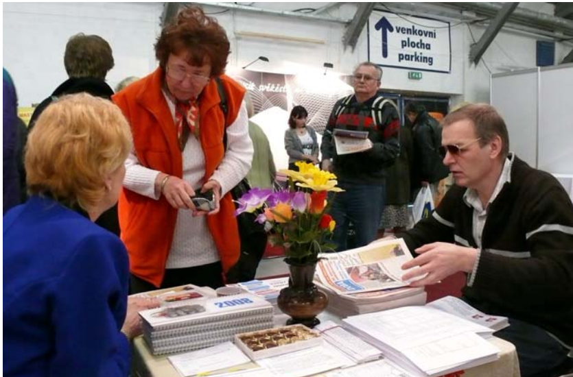
Na stánku Rady seniorů For senior 2008

V letňanské sérii veletrhů v sekci věnované seniorům mohli návštěvníci vidět více než 40 vystavovatelů. Jedním z nich byla i Rada seniorů se svým periodikem Doba seniorů. A zaznamenali jsme opět úspěšnou prezentaci naší činnosti i o našich novin. Návštěvníci vykoupili téměř všechna aktuální čísla našeho měsíčníku, získali jsme nové předplatitele. Znovu se ukázalo, že pokud by prodejci našich novin přistupovali k DS jako k tzv. velkým titulům, a seniorská veřejnost by tak o ní díky tomu více věděla, mohl by být prodej mnohem vyšší, než je dnes. Stejně úspěšné bylo šíření informací o činnosti Rady seniorů a zejména o jejich poradnách. Mnoho návštěvníků si bralo kontakty na naše pracoviště jak v Praze, tak i v Brně, Ostravě i Hradci Králové, kde všude máme otavřeny bezplatné poradny pro seniory. Jedná se zejména o oblasti právní, sociální a sociálně-právní, bytové a v poradně pražské i počítačové poradenství.