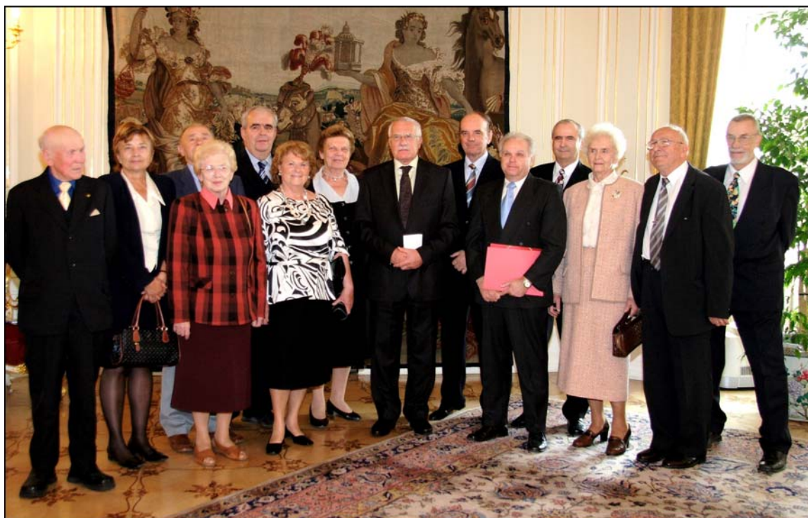
Přijetí delegace RS ČR prezidentem republiky u příležitosti Mezinárodního dne seniorů - 1. 10. 2007.

Rok 2007 byl pro Radu seniorů České republiky rokem významných změn v postavení, v rozsahu působnosti i v utváření vnitřní struktury orgánů. Do Rady vstoupila nová významná seniorská organizace (Republiková rada důchodců českých drah při OSŽ) a pět nových klubů důchodců. V Královéhradeckém a ve Zlínském kraji se podařilo ustavit krajské rady jako krajské organizační složky Rady seniorů České republiky. Současně byla v obou krajích navázána neformální spolupráce s krajskými samosprávami i s jejich představiteli. V listopadu pak byla Radě dle zákona č.108/2006 Sb., o sociálních službách přiznána akreditace poskytovatele odborného sociálního poradenství. A to pro kraje Prahu, Jihomoravský, Moravskoslezský a Královéhradecký. Za vysoké společenské uznání působnosti Rady je možno považovat přijetí její delegace prezidentem republiky u příležitosti Mezinárodního dne seniorů.