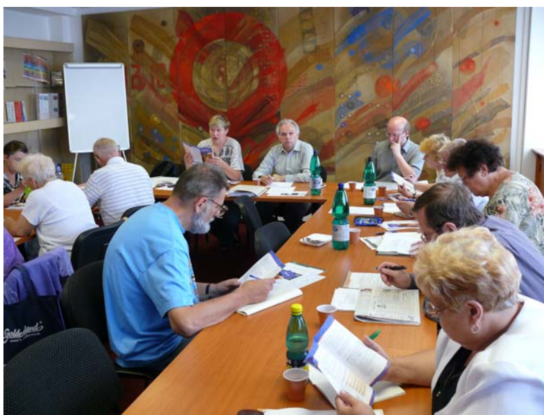
Internátní školení k etice činnosti sociálního pracovníka - červen 2007