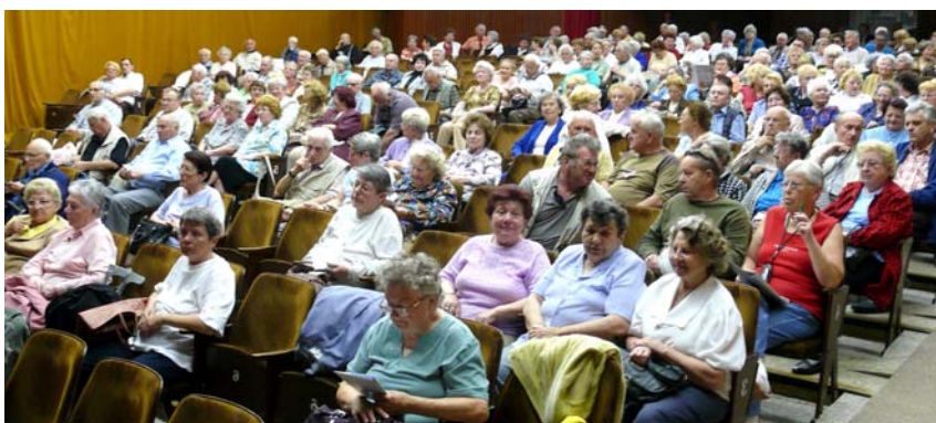
V Brně na setkání ministra zdravotnictví Julínka se členy Svazu důchodců ČR